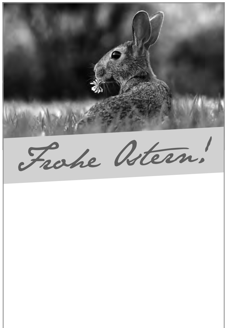
Anzeige-Nr. 4: 2-spaltig x 140mm