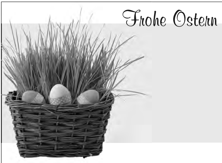
Anzeige-Nr. 2: 2-spaltig x 70mm