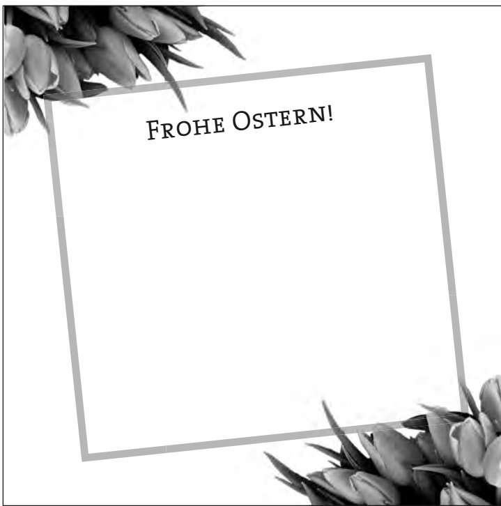
Anzeige-Nr. 1: 2-spaltig x 95mm