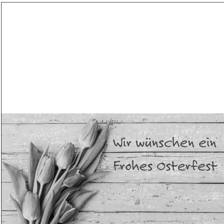
Anzeige-Nr. 3: 2-spaltig x 95mm