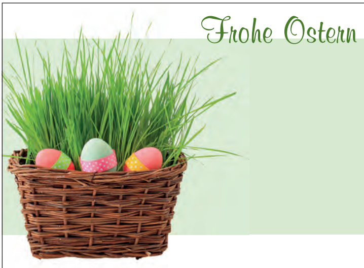
Anzeige-Nr. 2: 2-spaltig x 70mm