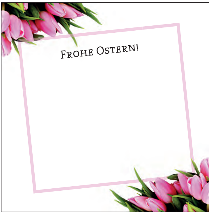
Anzeige-Nr. 1: 2-spaltig x 95mm